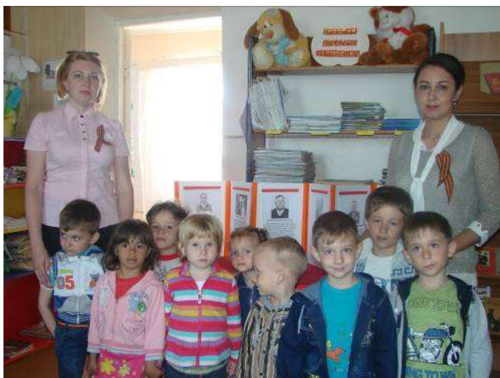
Экскурсия в библиотеку нашего поселка, посвященная Дню Победы.