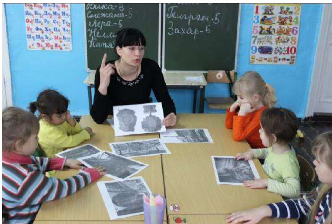
«Урок мужества» в память о Чернобыльской катастрофе.