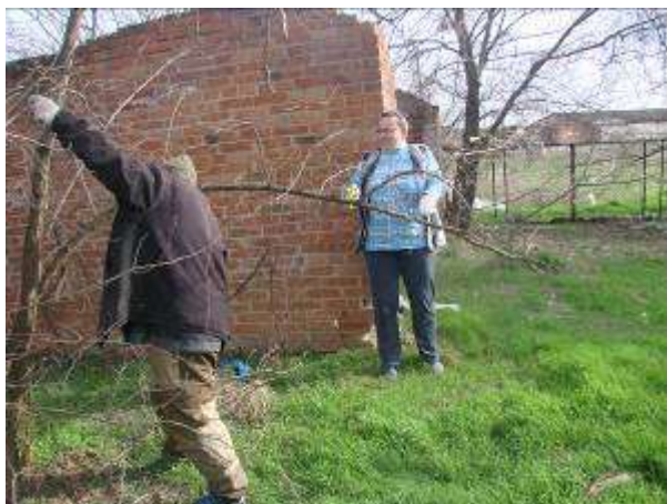
Субботник. Очистка кустарников от сухих веток.

Работая в одном ключе с педагогами, родители активно включались в общественную жизнь детского сада, с удовольствием шли на контакт, проявляли желание творить, узнавать и содействовать.