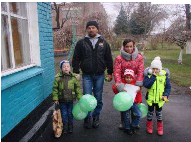
Акция по ПДД «Перевозка ребенка в автомобильном кресле».