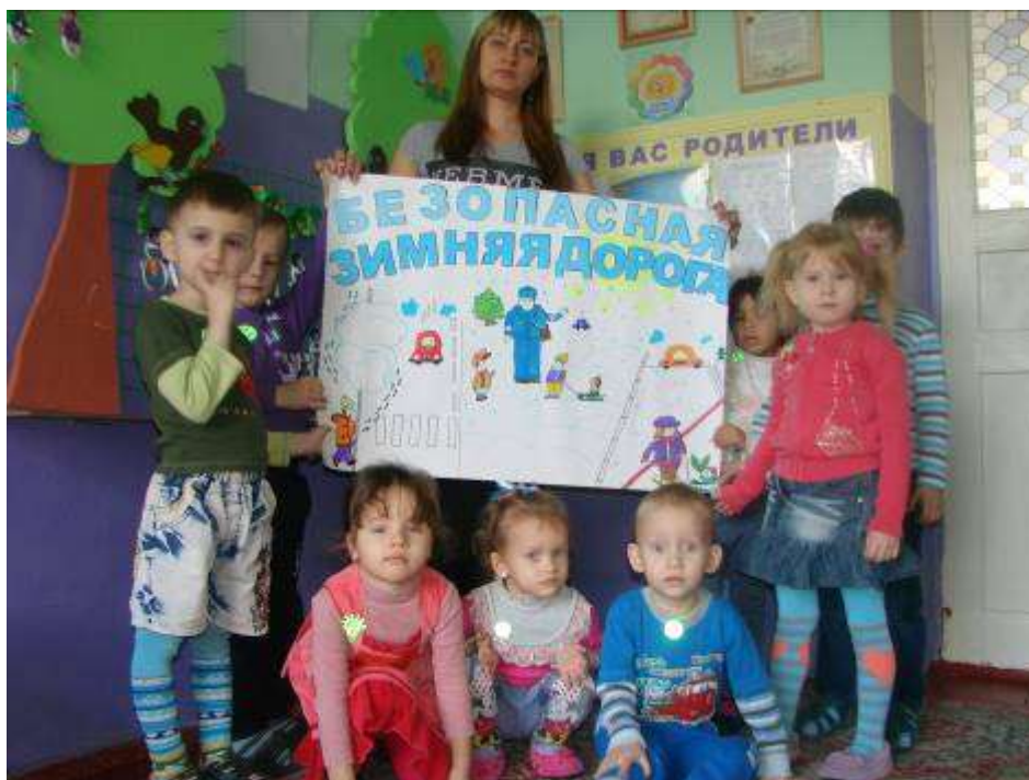
Занятие по ПДД «Безопасность на дороге в зимний период»