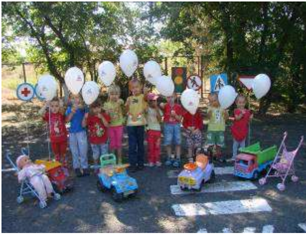
Праздник по ПДД «Внимание дети!»