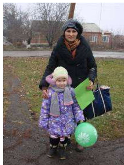
Вручение памяток «Автокресел много, жизнь у ребенка одна...»