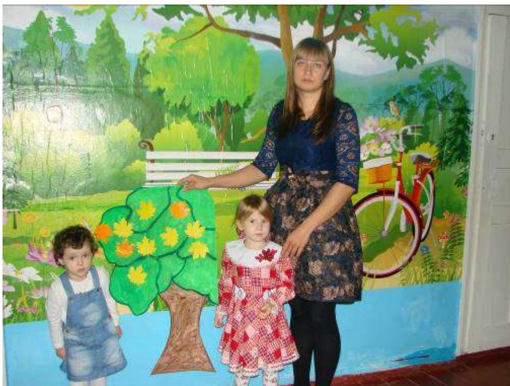
Символическое дерево памяти погибшим детям в автокатастрофе.