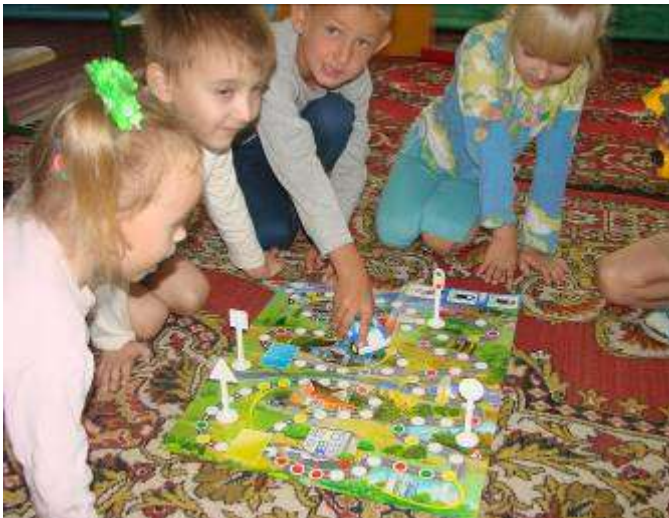
«День дорожного знака»