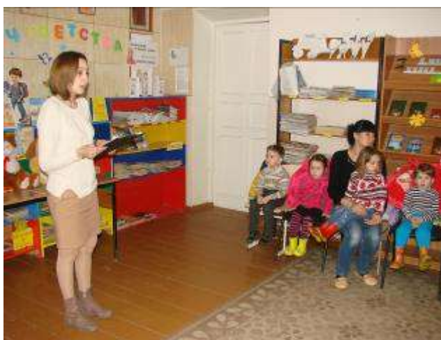
Экскурсия в библиотеку нашего поселка.