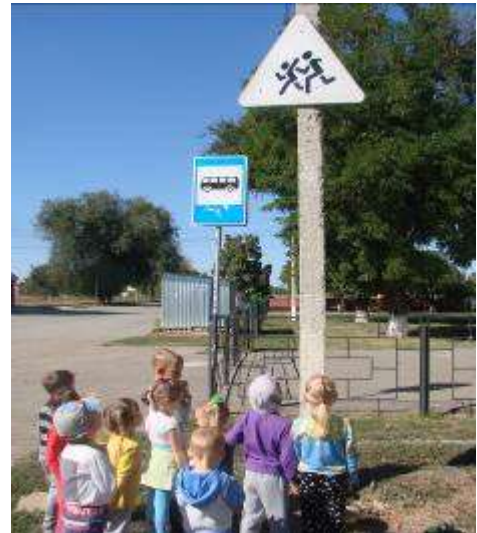
Целевая прогулка к автобусной остановке.