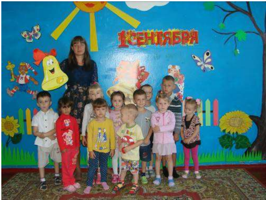
Праздник «День знаний»