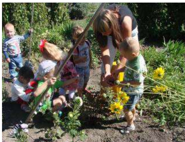
Очень любим мы трудиться. Сбор семян с клумбы