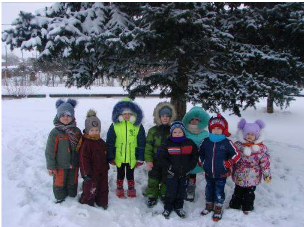
Акция по защите природы «Ёлочка – красавица на праздник к нам пришла»