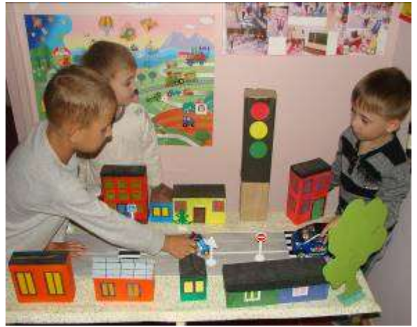
Сюжетно-ролевая игра «Дорожные знаки-друзья наши»