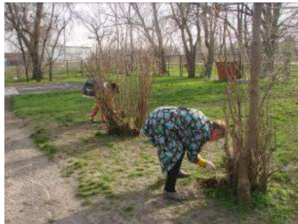
Экологический субботник «Природа – наш общий дом»