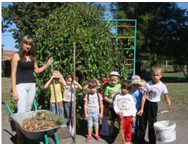
Субботник. «Приведем в порядок участок детского сада»